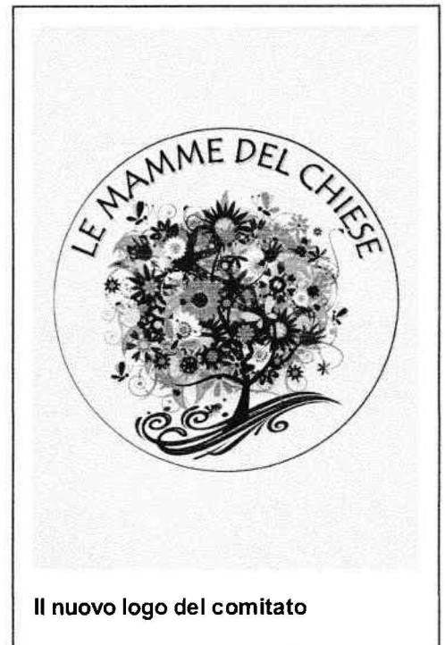
Il nuovo logo del comitato