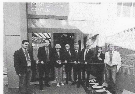
Inaugurazione. L'apertura dell'ufficio accanto al binario 1

In fase di progettazione definitiva da parte di Rfi è anche lo scalo merci di Brescia, la cosiddetta «Piccola», iniziativa che si collega alla costruzione del terminal intermodale della società svizzera Teralp. Si prevede la nascita di otto binari di arrivo/partenza lunghi