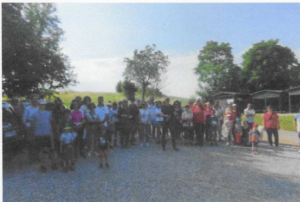
Montichiari I partecipanti alla marcia di protesta contro l'ampliamento delle Fontanelle

«Arrivati a questo punto tutto passa nelle mani del consiglio comunale - ricorda gli attivisti -, e con grande rammarico, ma non con sorpresa, le forze politiche che non ci hanno degnato di una risposta sono la Lega e Forza Italia. Nel prossimo consiglio sarà messo ai voti il nuovo Pgt, e in caso di approvazione le richieste della Fondazione che vuole espandere le Fontanelle verrebbero accolte. L'approvazione o meno della variante farà capire chi ha realmente a cuore il nostro territorio, e sarebbe ora che tutti prendessero una posizione: le nostre motivazioni le abbiamo espresse dal primo giorno».